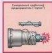
Самодельный обогреватель ("жарен")