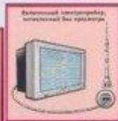
Включенный телевизор, подключенный без присмотра