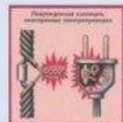
Подключенная к электросети, перегруженная электропроводка