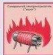
Самодельный обогреватель ("жарен")