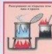
Разогревание на открытой плите пищи к обеду